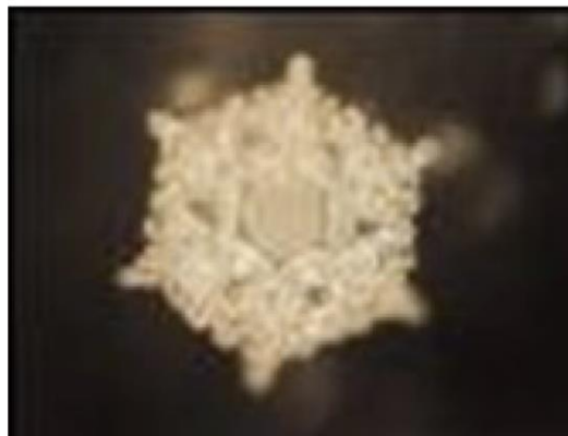
Love and Gratitude

In gewisser Hinsicht sind wir bewegliche Wassertanks die in einem Körper leben. Die Qualität des Wassers in uns steht folglich direkt im Zusammenhang zu dem, welche Art Mensch wir sind! Das deutet möglicherweise darauf hin, dass so lange wir im emotionalen/mentalen Griff unsere sechs Feinde, wie Wunsch, Zorn, Stolz, Gier, Anhaftung und Eifersucht sind, würde das Wasser innerhalb unseres Körpers, Gehirns und Herzens nicht rein sein. Wir können das Wasser in uns und um uns reinigen und aufladen, indem wir uns mit dem Wasser mit Positivität, Liebe und Dankbarkeit verbinden.